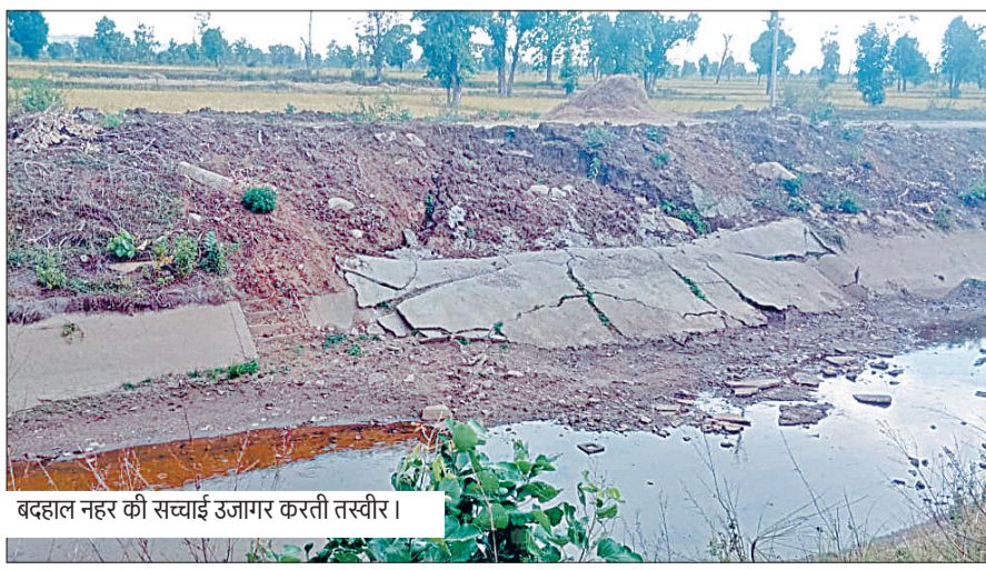
बदहाल नहर की सचवाई उजागर करती तस्वीर।

R बालाघाट | संवाददाता राष्ट्रबाण | rashtabaan.in हाल ही में जिले के लालबर्बा क्षेत्र में वैनगंगा दायी तट मुख्य नहर को लेकर स्थानीय समाचार पत्रों में खबरों का प्रकाशन कर संबंधित विभाग के अधिकारियों को मामला संज्ञान में लाने का प्रयास किया गया था कि वारिश के पानी की बर्बादी को रोकने के लिए नहर लाइनिंग कार्य में आने वाली दरारें और ध्वस्त हो गईं। दीवारों का निर्माण कार्य आवश्यक है। जिससे पानी का रिसाव न हो सके और सरकार की मंशा भी यही थी, इसलिए भारी भरकम रकम 127 करोड़ रुपए से अधिक की राशि का उपयोग कर इस मुख्य नहर का लाइनिंग सीमेंटीकरण कार्य किया गया था। विडंबना यह है कि यह कार्य कुछ