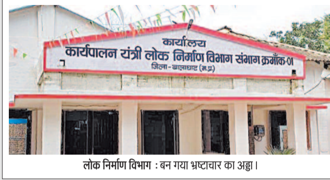
लोक निर्माण विभाग : बन गया भ्रष्टाचार का अड्डा।

करोड़ों की निर्माणधीन सड़क में कुछ ही दिनों में दरारें आने लगीं जिसमें ठेकेदार के लोगों के द्वारा दरारों पर लीपापोती कर दी गई है निर्माण के कुछ ही दिनों बाद सड़क में