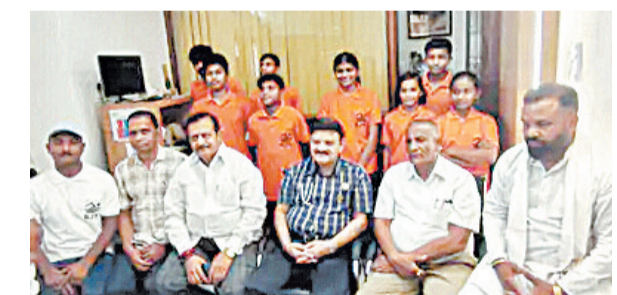
दशकों बाद भी नहीं बन सका स्वीमिंग पूल, नदी में करते हैं अभ्यास