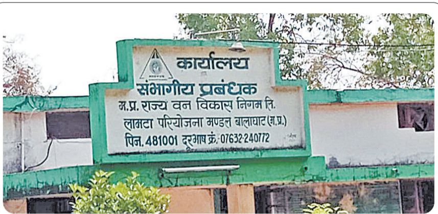
कार्यालय म.प्र. राज्य वन विकास निगम : बन गया अवैध लूट का अड्डा?

जानकारी के अनुसार मध्य प्रदेश वन विभाग के प्रावधानों के तहत ग्राम पंचायतों से प्राप्त टोकन रसीद के आधार पर हितग्राहियों को लगभग 383 रुपये प्रति चट्टा की दर से जलाऊ लकड़ी उपलब्ध कराई जाती है। लेकिन आरोप है कि लामता वन विकास निगम के चांगोटोला क्षेत्र अंतर्गत ग्राम सोनखार एवं पाटादेह के हितग्राहियों के नाम पर मनी रसीद काटी गई, जबकि जलाऊ लकड़ी की खेप ग्राम पंचायत गुरुद्वारा अंतर्गत हीरमनटोला में खाली कराई गई। जब इस संबंध में गुरुद्वारा उत्तर वन मंडल के बैरियर चेक पोस्ट पर जानकारी ली गई तो संबंधित ट्रेक्टर एवं मनी रसीद की कोई एंटी दर्ज नहीं पाई गई। इससे पूरे मामले में अनियमितता एवं विभागीय मिलीभगत की आशंका और भी