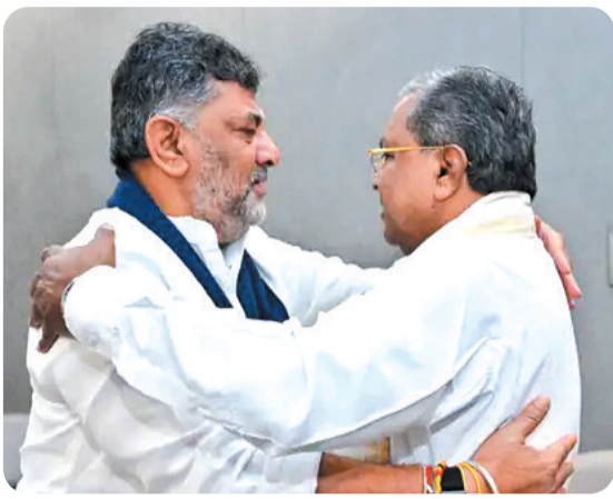
सीएम सिद्धारमैया ने डीके शिवकुमार को गले लगाया।

कर्नाटक विधानसभा के रिजल्ट 13 मई, 2023 को आए थे। कांग्रेस ने एचआईएनडीए फॉर्मूले के तहत पर