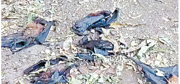
संक्रमण का खतरा, जांच के लिए सैपल जबलपुर भेजे गए