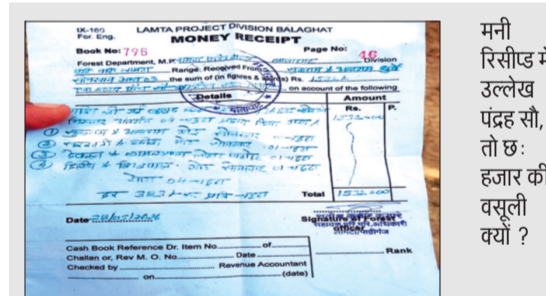
मनी रिसीद में उल्लेख पढ़ें, तो छः हजार की वसूली क्यों? विभाग को भारी राजस्व नुकसान पहुंच सकता है। ग्रामीणों ने

ग्रामीणों एवं क्षेत्रीय लोगों ने वन विकास निगम परियोजना परिक्षेत्र लामता में जलाऊ चट्टों के वितरण एवं बिक्री की निष्पक्ष जांच कराने की मांग की है। उनका कहना है कि यदि समय रहते कार्रवाई नहीं हुई तो