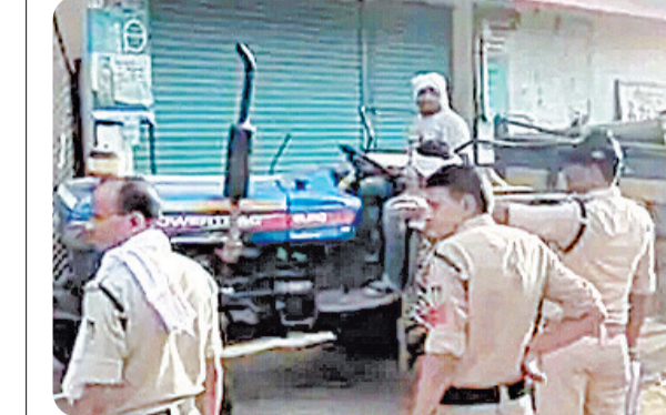
आपसी तालमेल की कमी का फायदा रेत माफिया जमाकर उठा रहे हैं। जब वन विभाग की बात आती है तो मामला राजस्व पर टाल दिया जाता है, और जब राजस्व की बारी आती है तो वन विभाग का बहाना बना दिया जाता है। इसी 'सीमा विवाद' की आड़ में माफिया लाखों रुपए की सरकारी संपदा पर डाका डाल रहे हैं।