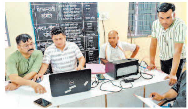
भ्रष्ट बाबू पर कार्रवाई करते लोकायुक्त टीम।