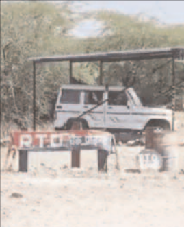
आगे की कार्रवाई कराई जाएगी।