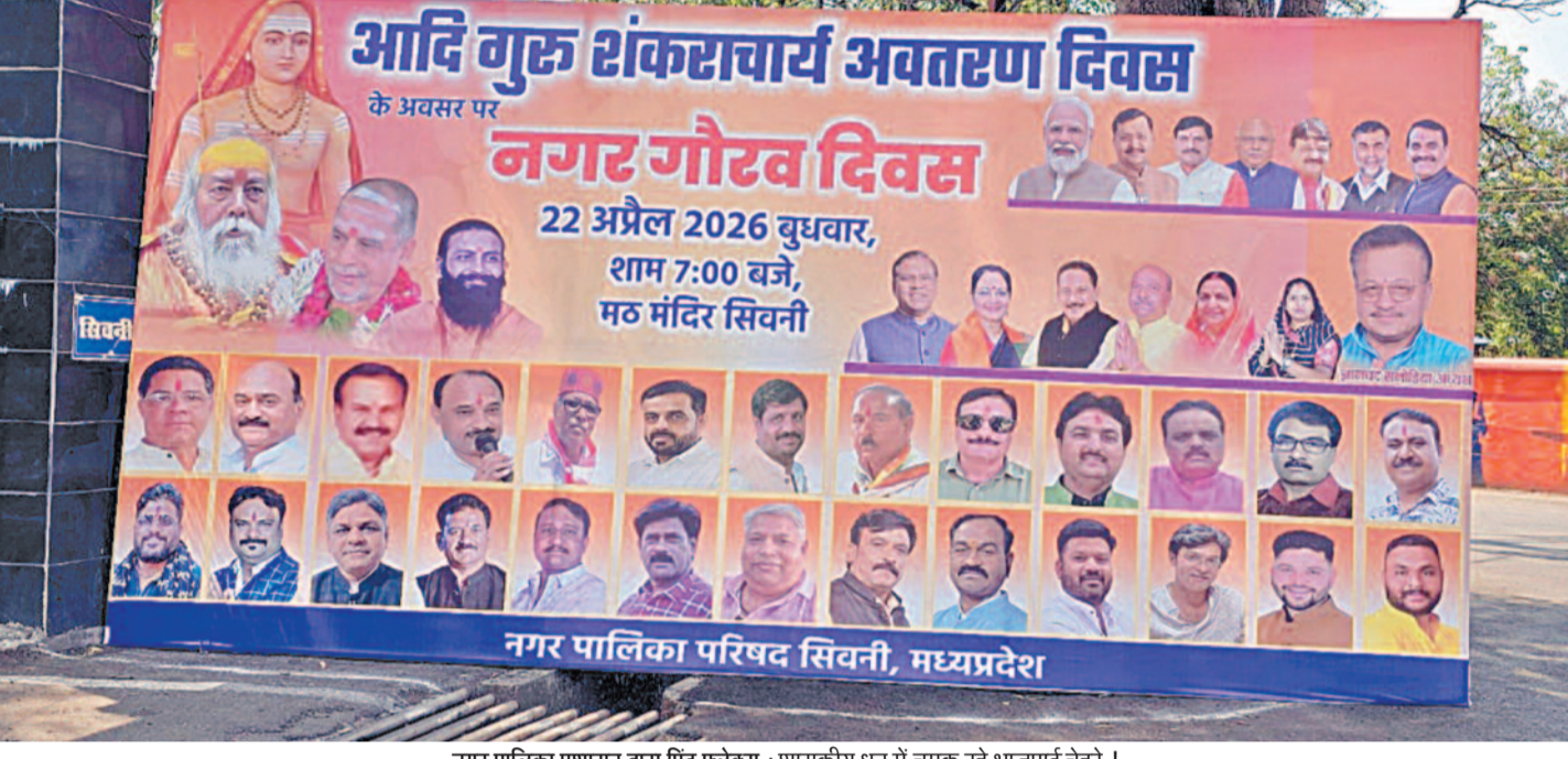
नगर पालिका प्रशासन द्वारा प्रिंट फ्लेक्स : शासकीय धन में चमक रहे भाजपाई चेहरे !

सरकारी आयोजन में पार्षदों के चेहरे गायब, 'अपनों' की तस्वीरों पर छिड़ा संग्राम