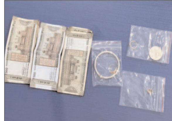
पर धावा बोला। चैनल गेट का ताला चटकाया, अलमारी खंगाली और