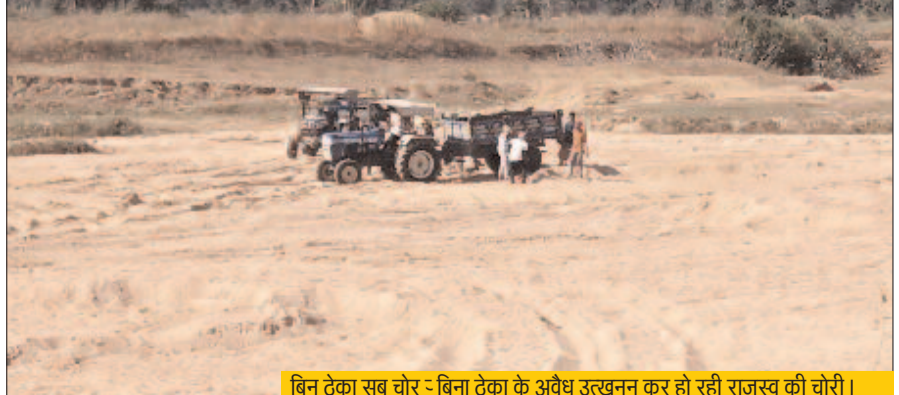
बिन ठेका सब चोर - बिना ठेका के अवैध उखनन कर हो रही राजस्व की चोरी।

पूरे जिले में जब रेत खदान स्वीकृत ही नहीं है याने की रेत खदान का ठेका ही नहीं हुआ है तो फिर ऐसी स्थिति में स्थानीय रेत माफिया और बड़े रेत माफिया रेत की चोरी और परिवहन कैसे कर रहे हैं ? स्थानीय चोर तो अपने ट्रैक्टरों के माध्यम से 5 से 10 ट्राली ही रेत चोर पाते हैं, कभी-कभी उन पर कार्रवाई भी होती है लेकिन वह बड़े चोर जो अपने डंपरों के माध्यम से जिले के बाहर रोजाना बड़ी मात्रा में रेत का अवैध उखनन और परिवहन कर