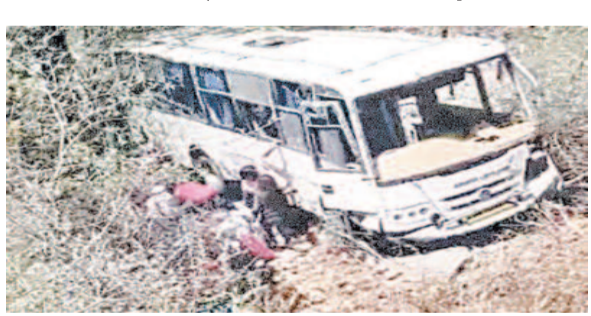
गई। 31 लोग घायल हो गए। पुष्कर जा रही बस में 33 लोग सवार थे।

कपड़ों से रस्सी बनाकर बाहर निकाला; बिना इंश्योरेंस-फिटनेस के दौड़ रही थी गाड़ी