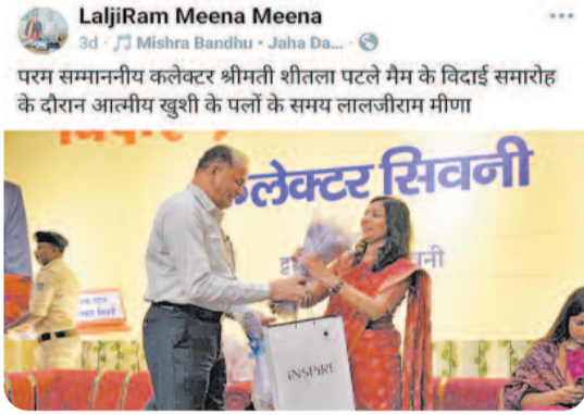
वह पोस्ट जो अब विवाद और सुर्खियों में बनी है।