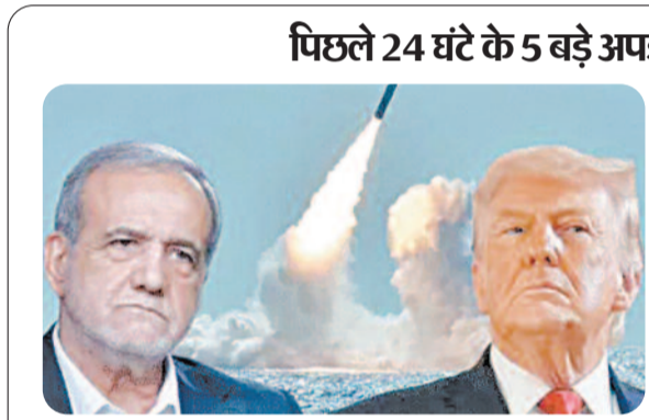
भारतीय जहाजों पर फायरिंग-ईरान ने होर्मुज में 2 भारतीय जहाजों पर फायरिंग की। 14 जहाज रोके गए, 13 वापस लौटे। भारत ने राजदूत को तलब कर विरोध जताया। होर्मुज स्ट्रेट फिर बंद- ईरान ने अमेरिका पर सीजफायर

तेल अवीव। एजेंसी राष्ट्रबाण rashtrabaan.in