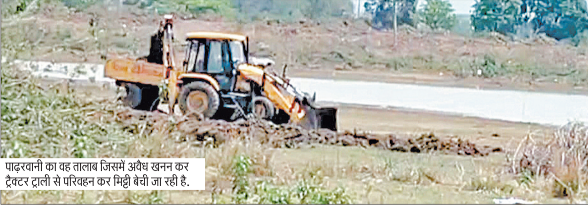
पादरवानी का वह तालाब जिसमें अवैध खनन कर ट्रैक्टर ट्राली से परिवहन कर मिट्टी बेची जा रही है।

शनिवार देर शाम को तालाब से खनन कर कॉलोनाइजरों के प्लॉटों में डाली जा रही मिट्टी: ग्रामीण