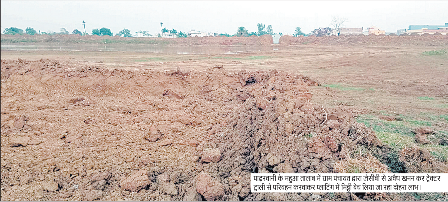
पादरवानी के महुआ तालाब में ग्राम पंचायत द्वारा जेसीबी से अवैध खनन कर ट्रैक्टर ट्राली से परिवहन करवाकर प्लांटिंग में मिट्टी बेच लिया जा रहा दोहरा लाभ।

लोगों ने बताया कि खनन की शिकायत भी करते हैं पर कोई कार्रवाई नहीं हो रही है। ग्रामीणों का कहना है यदि मिट्टी खोदने की सूचना स्थानीय पुलिस थाने,