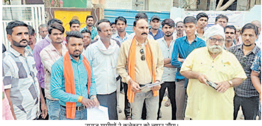
नाराज ग्रामीणों ने कलेक्टर को ज्ञापन सौंपा।

सिवनी जिले के कुरई ब्लॉक के ऐरमा गांव में करोड़ों की लड़िया खोली जलाशय परियोजना पिछले तीन साल से अधूरी पड़ी है। टेकेदार काम छोड़कर गायब हो चुका है, प्रशासन की चुप्पी से ग्रामीणों का गुस्सा फूट पड़ा है। अब लोगों ने साफ चेतावनी दी है, अगर जल्द काम शुरू नहीं हुआ तो सड़क से लेकर दफतर तक आंदोलन होगा।