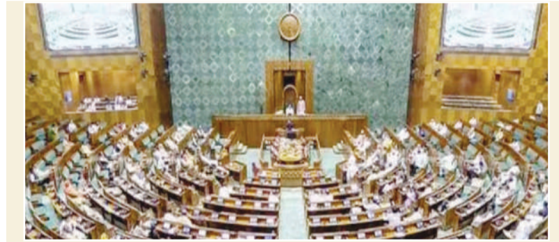
विपक्षी दल मतदाता पहचान पत्रों में एक जैसे नंबर का मामला भी इस तरह उठा रहे हैं जैसे इससे भी चुनावी धांधली होती हो...