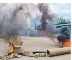
ताजा हिंसा के बाद स्थानीय कुकी समुदायों की ओर से जैसी प्रतिक्रिया आई है, वह इसी का उदाहरण है। कुकी समुदाय का प्रतिनिधित्व करने वाले एक संगठन की ओर यह कहा गया कि वे शांति का समर्थन करते हैं...